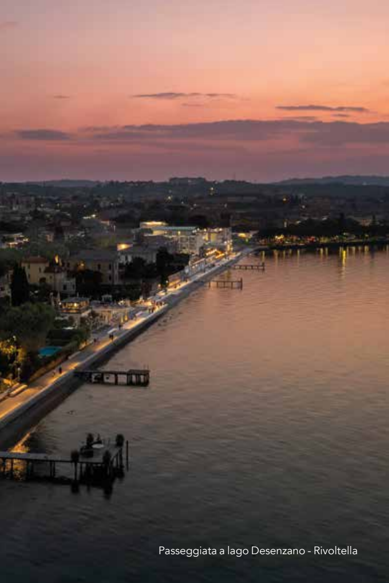
Passeggiata a lago Desenzano - Rivoltella